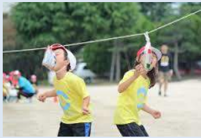
運動会 パン食い競争

チャスキでは年間たくさんのプログラムがあります。日々の練習、毎週の練習はもちろんですが、チャスキの目指すたくましさ、しなやかさ、やさしさ。体も心も成長するために、普段の練習とはちがった体験をすることで、また一段と子どもたちは大きくなっていきます。子どもたちは、それぞれの大事な場面で仲間を信じる絆や自分を信じて進む精神力を培っていきます。