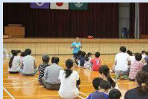
学校PTC行事での様子